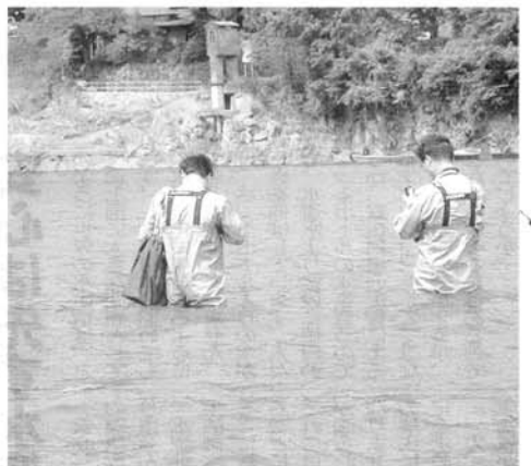
相模川での調査・採水