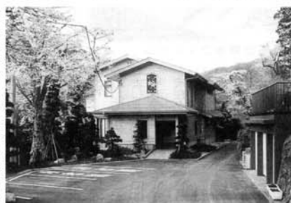
水源林事務所の全景

森は、天然林または針葉樹と広葉樹の混合林です。横浜市水道局水源林事務所ではこの森の実現と保護育成に向け努力しています。