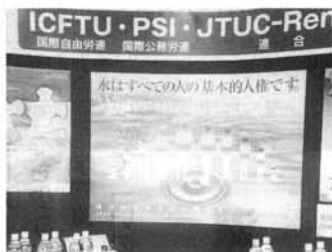
展示コーナーの風景

一九日の午前中には、「公共の水」今後の方向」と午後からは「水基本法を考える」のふたつのパネルディスカッションという形で行われ、水基本法については、満員の盛況で諸外国からの参加者も多く、英語、フ