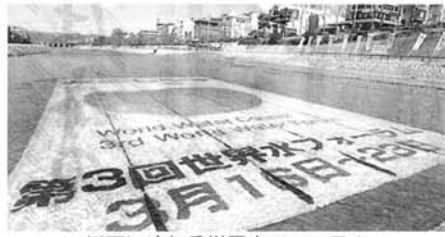
川面にゆれる世界水フォーラム

このように世界の水事情は、とりわけ途上国に大きな問題としてあります。しかし日本においても河川の水質悪化に見られるように憂慮できる状況にはありません。 最近、ペットボトル入りの水が売れ行きを伸ばしています。人々はなぜ、水道水より格段に値段の高いペットボトルの水を買ったのでしょうか。宣伝効果の影響による単なるファッションとしてではなく、濃密としたものでしょうか、不安定な水質が、これはあるのではないのでしょうか。 安心して飲める水はまず、水源の環境改善に取り組みなければなりません。 水源地の整備や河川に流れ込む生活排水の問題などの解決には、そこに複数の行政がまたがっていることに始まる難題があります。 これには広域的に、統一して解決が図られるための仕組みがなければなりません。私たちは、この問題の解決に向けて「水基本法」の制定を求めています。 一方、河川や地下水に有害な化学物質が入り込んでしまつてい